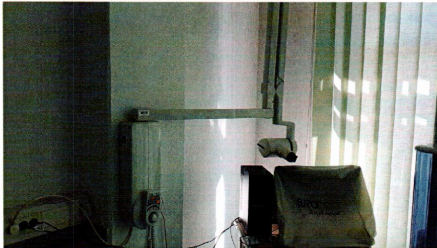
Slika 1: Rentgenski aparat CARESTREAM CS 2200