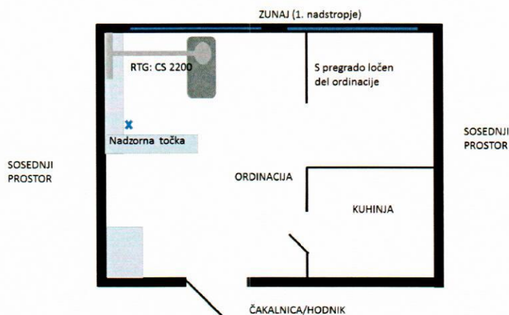
Slika 2: Shematski tloris namestitve RTG aparata v zobni ambulanti.